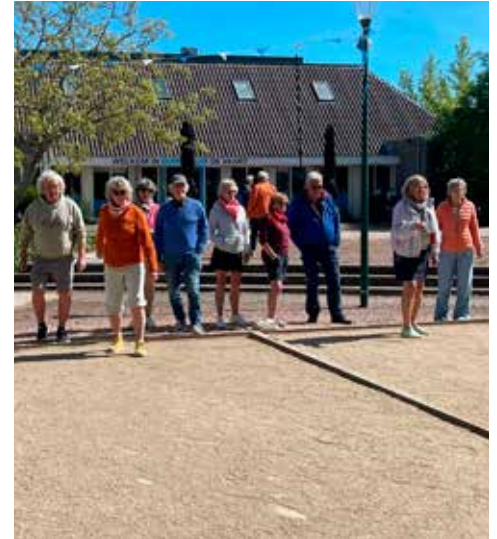
Jeu de boules bij De Vaart

ven ze aan terug te kijken op een heerlijke dag. Linschoten liet zich zien als een warm, gastvrij dorp vol mooie details en fijne plekken. Een dorp om trots op te zijn.