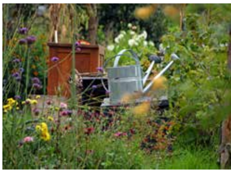
Veel ruimte voor bijen en hommels in de moestuin