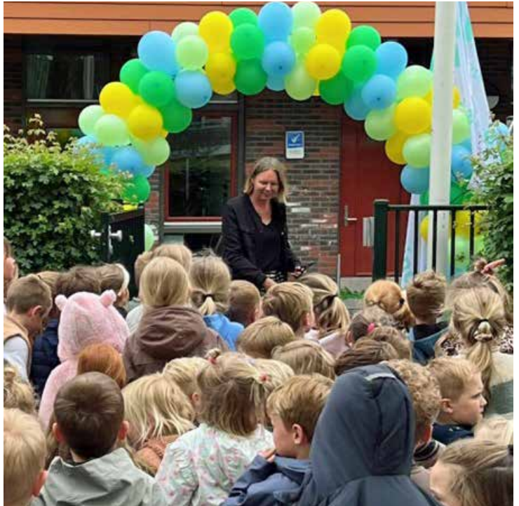
Opening van het vergroende speelplein van de Timotheÿs-school.

Voordat ze het lint doorknipt, dankt directeur Marijn van Moolenbroek Selma, haar collega's, subsidieverstrekters, sponsors, en ouders. Die laatste zeker ook